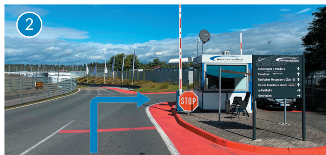
Pforte, im Anschluss rechts abbiegen