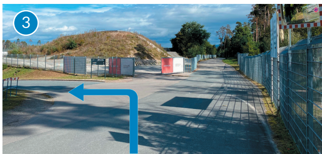
Links abbiegen, Richtung Tunnel