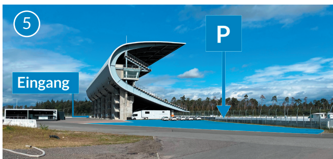
Osttribüne, rechts davon Parkplätze