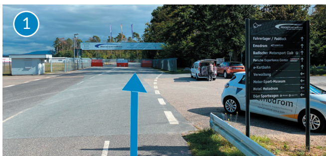
Eingang Richtung Fahrerlager

Sobald Sie in unmittelbarer Nähe zum Hockenheimring sind, orientieren Sie sich bitte Richtung „Fahrerlager“ (1), bevor Sie am Schrankenhaus Rechts abbiegen in Richtung „Osttribüne/emodrom e-kartbahn“ (2). Folgen Sie der Straße, biegen Sie links ab (3) und durchqueren Sie den Tunnel. Im Anschluss biegen Sie rechts ab (4) und folgen der Straße solange, bis Sie an der Osttribüne ankommen. Parken Sie bitte auf dem Schotterplatz und laufen Sie die letzten Meter auf der linken Seite der Osttribüne bis zum Eingang der e-Kartbahn.