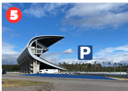
Osttribüne, rechts davon Parkplätze