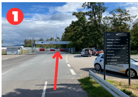
Eingang Richtung Fahrerlager

Sobald Sie in unmittelbarer Nähe zum Hockenheimring sind, orientieren Sie sich bitte Richtung „Fahrerlager“ (1), bevor Sie am Schrankenhaus rechts abbiegen in Richtung „Osttribüne/emodrom e-Kartbahn“ (2). Folgen Sie der Straße, biegen Sie links ab (3) und durchqueren Sie den Tunnel. Im Anschluss biegen Sie rechts ab (4) und folgen der Straße solange, bis Sie an der Osttribüne ankommen. Parken Sie bitte auf dem Schotterplatz und laufen Sie die letzten Meter zum Eingang der Osttribüne.