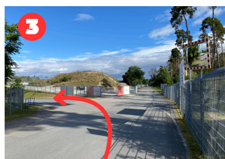
links abbiegen Richtung Tunnel