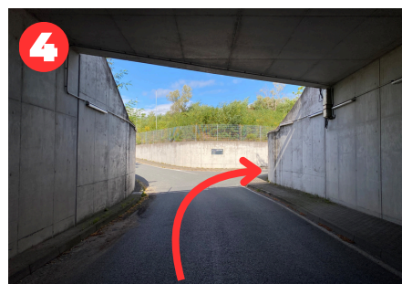
Rechts abbiegen Richtung Ostfläche