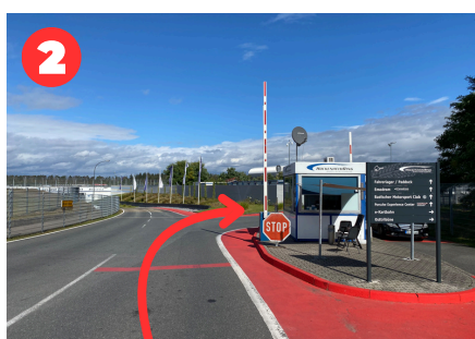
Schrankenhaus, im Anschluss rechts abbiegen