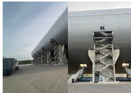
Eingang Osttribüne: Lift bei Aufgang „K“