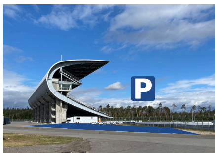
Osttribüne, rechts davon Parkplätze