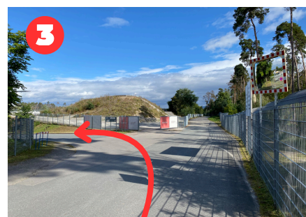
links abbiegen Richtung Tunnel