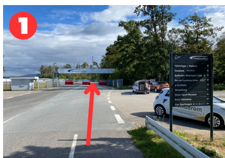
Eingang Richtung Fahrerlager

Sobald Sie in unmittelbarer Nähe zum Hockenheimring sind, orientieren Sie sich bitte Richtung „Fahrerlager“ (1), bevor Sie am Schrankenhaus rechts abbiegen in Richtung „Osttribüne/emodrom e-Kartbahn“ (2). Folgen Sie der Straße, biegen Sie links ab (3) und durchqueren Sie den Tunnel. Im Anschluss biegen Sie rechts ab (4) und folgen der Straße solange, bis Sie an der Osttribüne ankommen. Parken Sie bitte auf dem Schotterplatz und laufen Sie die letzten Meter auf der linken Seite der Osttribüne zum Eingang der e-Kartbahn.